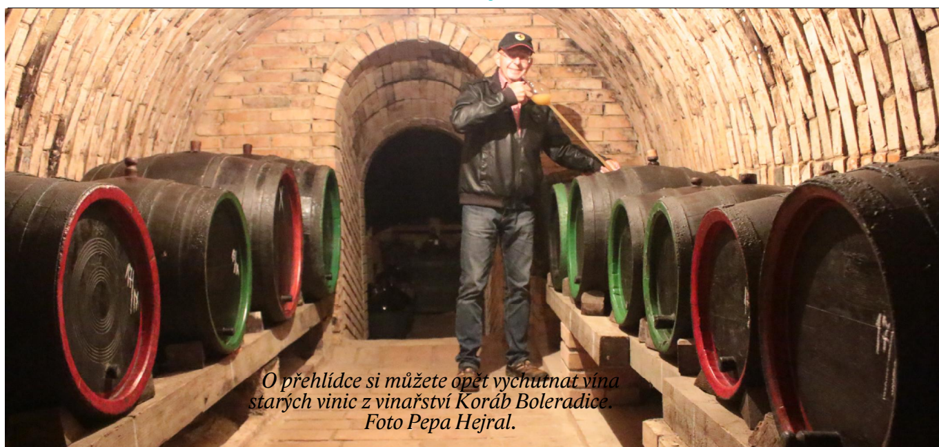
O prohlídce si můžete opět vychutnat vína starých vinic z vinařství Koráb Boleradice.