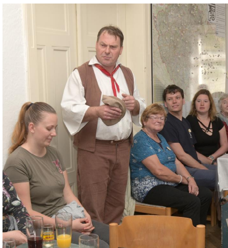
(Pokračování ze stránky 1)

řiminutové zpoždění. Marcela Škodová prohlásila, že se oběma pondělními představeními cítí obohacená, že Boleradickým i Nučickým přeje plná hlediště, hodně mladých i dětí, protože: „Nám starším občas dochází dech, i když nechybí zápal.“