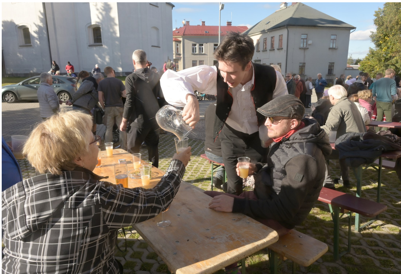
DS bratři Mrštíků Boleradice přivezli ze svého kraje typické ovoce, a to jak v pevném stavu, tak v perlivé formě. Tradiční burčák měl velký úspěch a brzy byly džbánky prázdné.