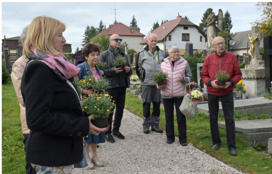
Každý rok si připomínáme všechny ty, kteří tu s námi nemohou být.

Honza tak má sice pocit, že by se přehlídka už skoro měla lámat, nicméně jedna z donátorek KDP dorazila na večerní představení s rodinou o celý týden dříve. Inu, čas je veličina velmi proměnná a plyne rychleji, než bychom si často přáli. (jn)