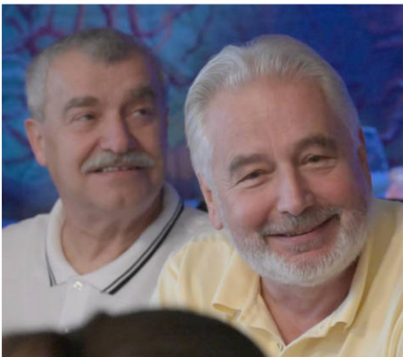
Dovolte mi přivítat Velkou....

Haluz, honem pojdte blíž, vyměňte se s Amadis. A nebo si můžete sedět u jednoho stolu a držet se za ruce. (Petra Richter Kohutová)